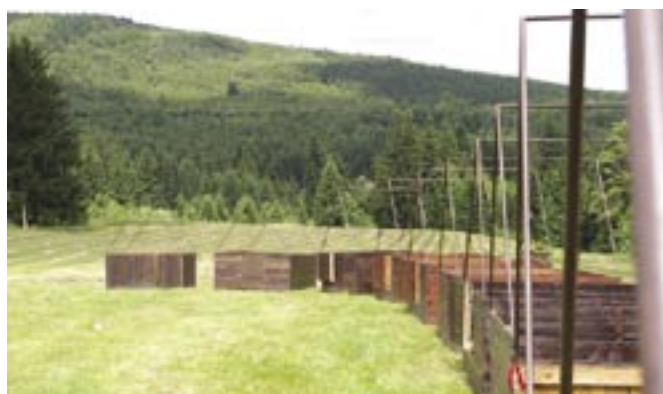
Stavba stanů první den tábora