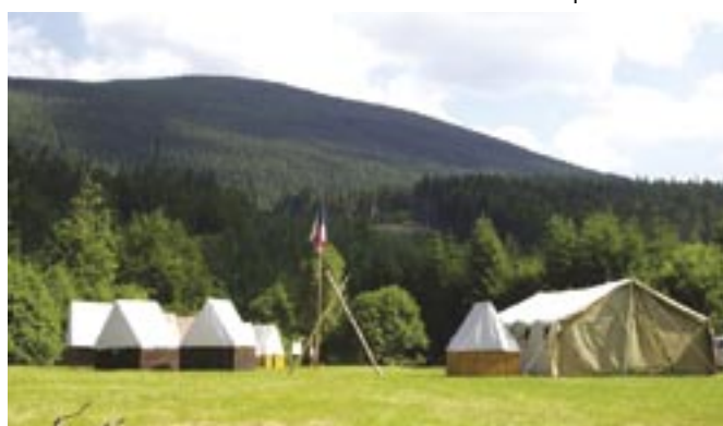
Pohled na tábor pod Šerákem