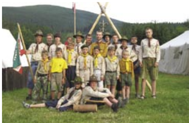
Účastníci tábora 2008