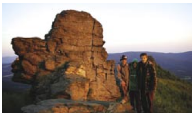
Východ slunce na Obřích skalách