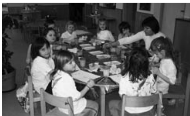
Výtvarná aktivita Barvínek.