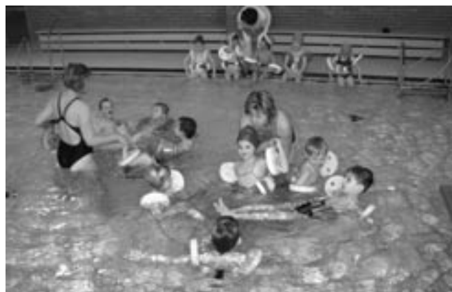
Předplavecká výuka v Šumperku.