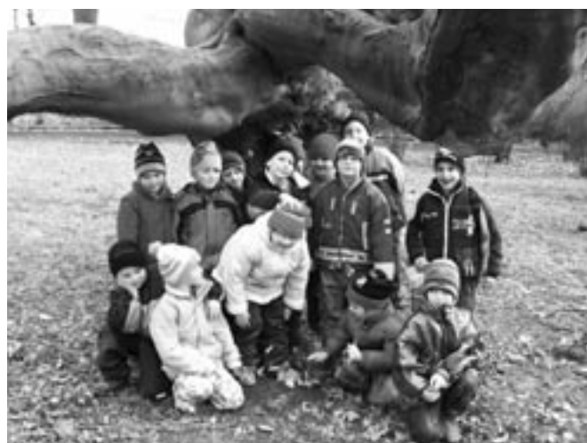
Přírodovědná aktivita Brouci.