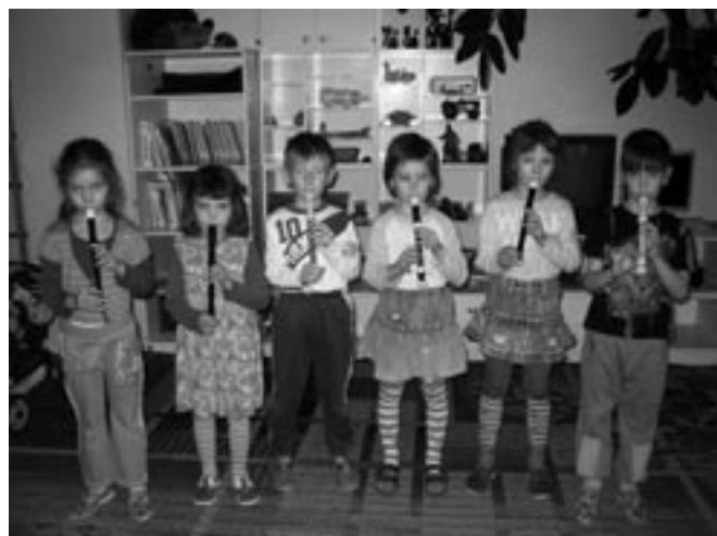
Veselé pískání pro zdraví.