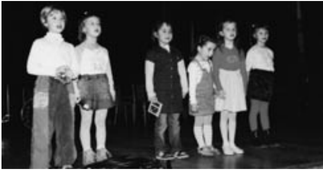
Vystoupení dětí v kulturním domě pro důchodce.