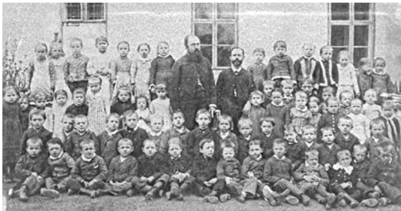
Žáci první třídy ve školním roce 1890/91