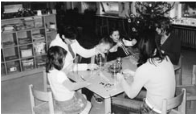
Vánoční tvoření s rodiči.