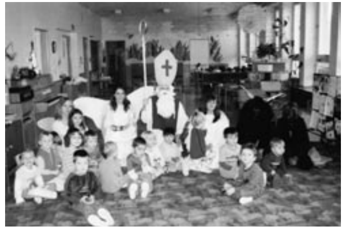
Mikuláš s čerty - přišli žáci ze ZŠ Bludov.