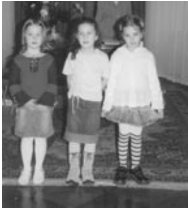
Děti z mateřské školy