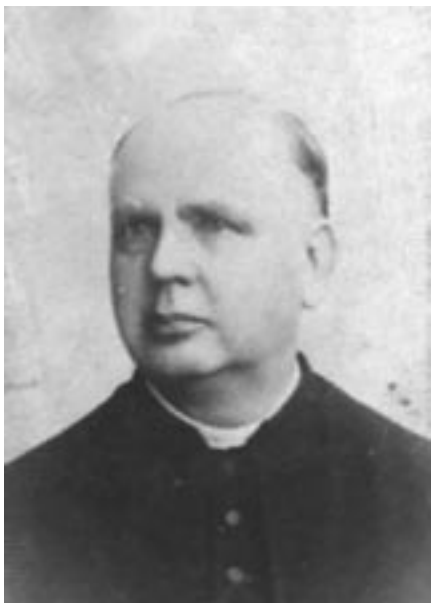
P. Fr. Ermis

svatě Rosálie, která je ozdobou této části obce již téměř 140 let.