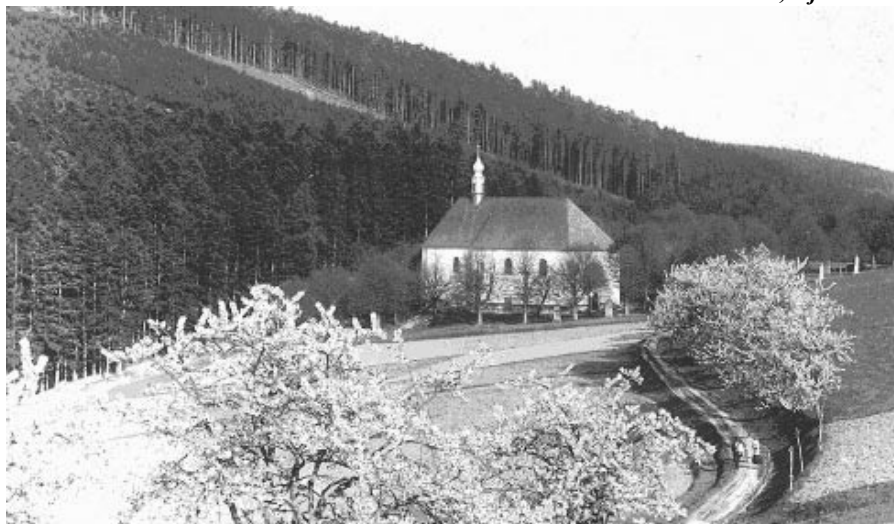
Kostelíček Božího Těla

Pokračování příště Stanislav Balík st., říjen 2006