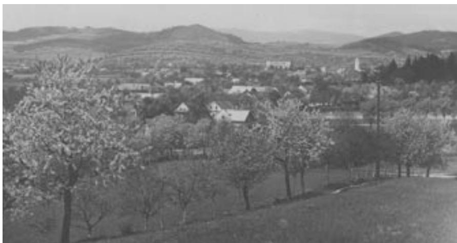
Pohled z Brusné na tzv. Učitelův vrch – všimněme si spousty ovocných alejí, dnes již vesměs zaniklých