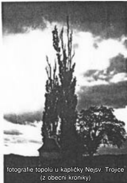
fotografie topolů u kapličky Nejsv. Trojice (z obecní kroniky)

Na str. 59 obecní kroniky je tato fotografie a tento zápis: