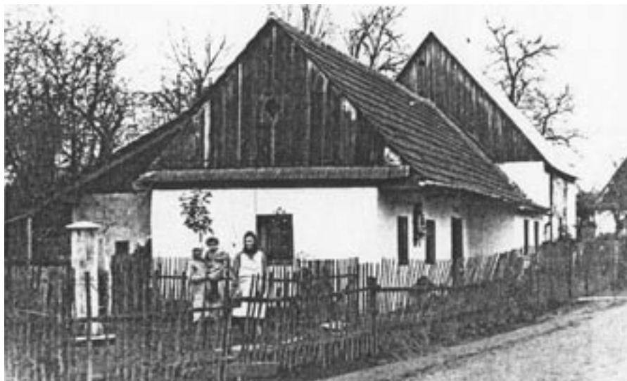
fotografie domu čp. 270 (z obecní kroniky)

Na str. 77 obecní kroniky je následující fotografie: