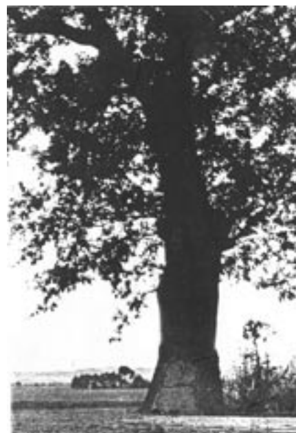
fotografie „Hraničákou doubku“ (z obecní kroniky)

Na str. 77 obecní kroniky je následující fotografie: