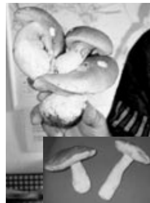
Z letošní bohaté úrody hub v okolí Bludova.