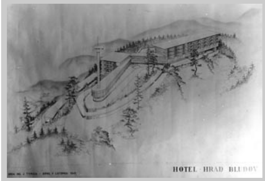
Neuskutečňovaný návrh na výstavbu bludovského hotelu „Hrad Bludov“ z r. 1945

Vedoucí činitelé MNV a KSČ měli z důvodů pol. propagačních zájem na jeho znovuzřízení. A proto MNV uzavírá v roce 1948 s Čsl. st. filmem v Praze smlouvu, již se zavázal, že upraví svým nákladem místnosti v Národní domě, č. 353, který se stal předtím obecním majetkem. Národní dům byl potom upraven značným nákladem, načež po četných urgencích u Čs. státního filmu byl společností namontován do nově upravené kabiny promítací stroj a provoz kina v r. 1950 zahájen.