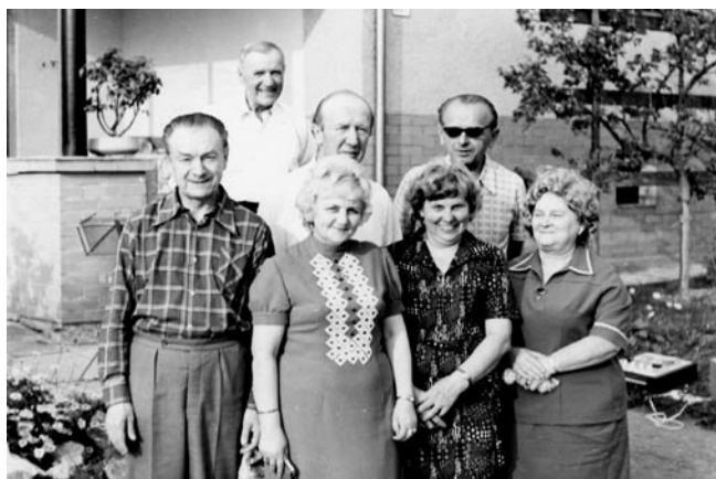
Členové Smyčkového kvarteta s manželkami v sedmdesátých letech