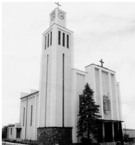
Kostel sv. Cyrila a Metoda