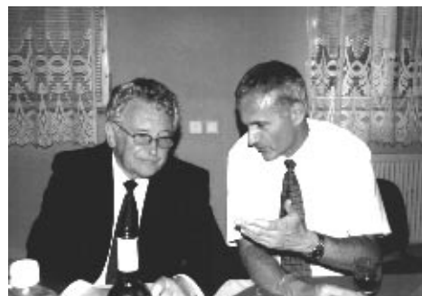
Foto starostů Bludova a Lehoty pod Vtáčnikom

Obec Lehota pod Vtáčnikom se stala naší partnerskou – družební obcí v letošním roce. Delegaci naší obce, složené se zástupců vedení obce, základní školy, kulturního domu a fotbalového oddílu, která navštívila Lehotu v červnu letošního roku, se dostalo mimořádně vřelého přijetí a byly navázány