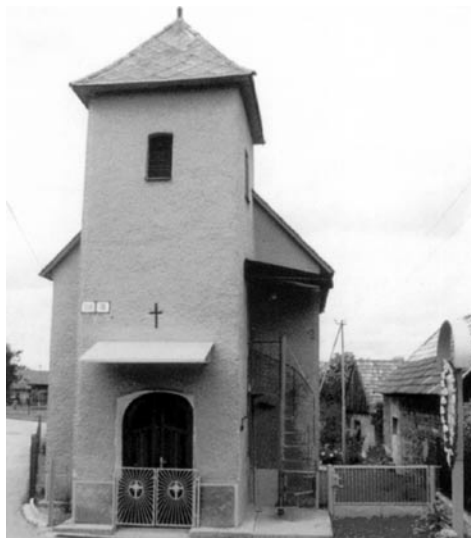
Kaplnka s. Vendelína