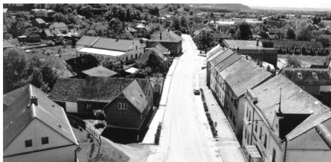
Pohled na Trídu A. Kašpara z lešení při opravě kostela dne 16. 5. 2004

je název publikace, která byla vydána k příležitosti 70. výročí úmrtí Adolfa Kašpara, ilustrátora klasických děl české literatury, vynikajícího kreslíře, malíře a grafika. Publikaci vydalo Vlastivědné muzeum v Šumperku a můžete si ji zakoupit v Kulturním domě Bludov.