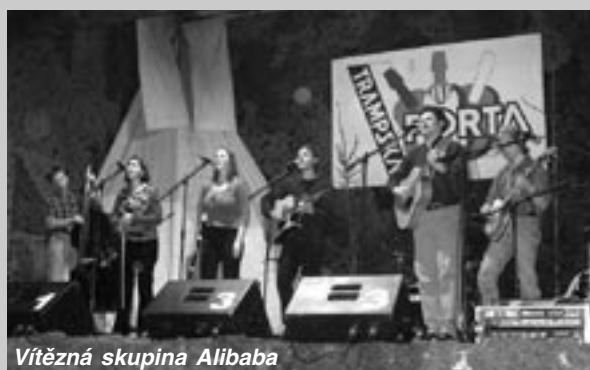
Vítězná skupina Alibaba