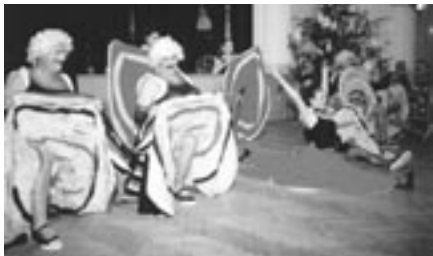
Mikulášská pro důchodce