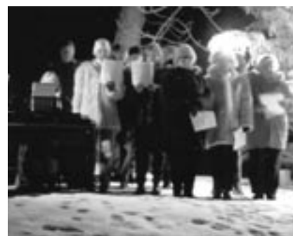
23. 12. 2003 – "Zpívání u stromu".

Hostem koncertu byl komorní soubor učitelů ZUŠ Zábřeh "Camerata quintet"