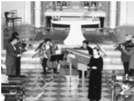
7. 12. 2003 – 2. adventní koncert

Hostem koncertu byl komorní soubor učitelů ZUŠ Zábřeh "Camerata quintet"