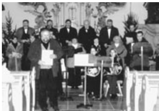
19. 12. 2003 – Canzonetta Bludov a Collegium Bucinatorum, Zábřeh – vánoční koncert v kostele nanebevzetí Panny Marie ve Štítech.