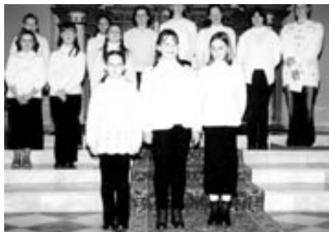
30. 11. 2003 – 1. adventní koncert