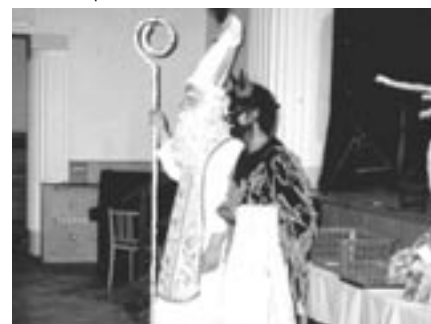
Mikulášská pro děti