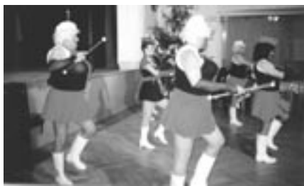
Mikulášská pro důchodce

perníčků a získat některou z výher v tombole. Poděkování patří všem členkám sboru pro občanské záležitosti za pomoc s organizací, členům pionýrské skupiny za každoroční zdobení vánočního stromu v kulturním domě a samozřejmě sponzorům, kteří věnovali dárky do tomboly.