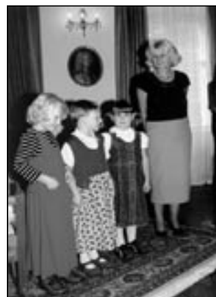
Děti z mateřské školy