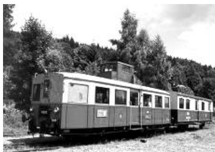
starý motorový vůz

Dnes je tato situace, bohužel, ještě horší, částečně k tomu přispělo i dočasné uzavření úseku Chromeč – Postřelmov v květnu letošního roku. Tento stále se stupňující problém měl vyřešit „obchvat“, který by odklonil většinu projíždějících vozidel mimo obec. Jedna z etap tohoto obchvatu, a to obchvat Postřelmova /provádí firma Strabag/ probíhá v současné době. Dále je v plánu obchvat Rájce, Vlachova, Zvole... Obchvatu Bludova se však v nejbližších letech, bohužel, nedočkáme.