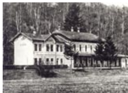
Bludovské nádraží pravděpodobně ve dvacátých letech minulého století