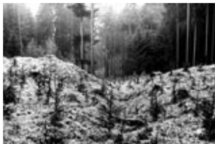
Rozbořená hráz většího ze dvou rybníků, pod kterou pravděpodobně ještě leží stavidlo.

Přestože RNDr. Josef Večeřa bydlí až v Jeseníku, zná okolí Bludova mnohem podrobněji a dokonaleji než kdokoliv z nás. Je totiž spoluautorem souboru geologických map v měřítku 1:25000, které zaznamenávají strukturu podloží okresů Šumperk, Zábřeh a Jeseník. Celý život tedy chodil křížem kráčem po krajině a všiml si věcí, které laické oko vůbec nezaznamená. Naučil se tak dívat na svět úplně jinými očima: všímá si terénních zlomů a vln, z mezi a hrbolů je schopen určit, je-li daná krajina ovlivněna lidskou