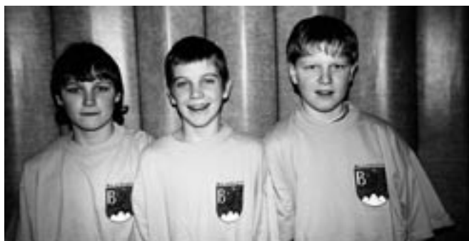
Vítězové okresního kola.