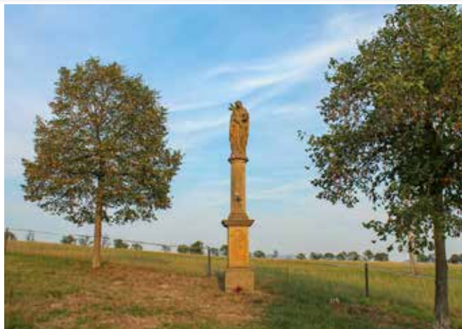
Socha sv. Rozálie (autorka: Pavlína Koncošová, drobnepamatky.cz)

Její šílený bludovský průběh si asi ani neumíme představit. Řádila tehdy v celém okolí. V Bludově podle