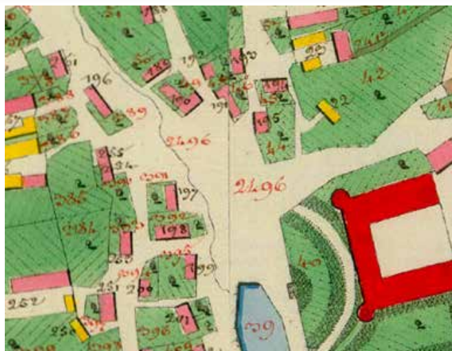
Prostor u dnešní křižovatky u zámku na mapě Stablního katastru z roku 1834

První padl za obět' dům čp. 270 – už obecní kronikář Václav Blažek v padesátých letech označil v obecní kronice odvážně jeho zbourání za projev „bourací horečky“, která se tehdy šířila ze Šumperka. Domek byl totiž v dobrém stavu, jen prý byl nevhodně umístěn. Ještě 6. února 1948 žádala marně o jeho zakoupení místní Hospodářská záložna, aby jej mohla přebudovat na úřadovnu záložny. Na její žádost už nikdo neodpověděl. Domek byl zbourán a Hospodářská záložna zůstala a rozehnána. Na místě dvacet let nic nebylo, v první polovině šedesátých let tam byl přemístěn pomník A. Kašpara a u něj byly 28. října 1968 vysazeny dvě tzv. lípy republiky – k padesátému výročí vzniku Československa. Stál tam do loňska, kdy byl nahrazen venkovní galerií Adolfa Kašpara a pomník samotný byl přesunut na protější stranu silnice.