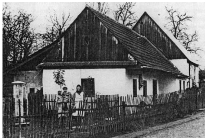
Dům čp. 270 v prostoru dnešní venkovní Galerie Adolfa Kašpara (obecní kronika)

Po roce 1741 se něco stalo – nevíme ale přesně jak. Takové „prázdné“ prostory ve vsi patřily bludovské obci. Ta je postupem času začala prodávat jednotlivým lidem, aby si na nich stavěli chaloupky (v té době docházelo k dramatickému nárůstu počtu obyvatel, kteří by jinak neměli kde bydlet). Jen mezi lety 1771 a 1790 přibýlo v Bludově 38 domů, přičemž všechny vznikly na těchto volných parcelách na široké obecní návsi. Během dalších dvaceti let přibýlo dalších 45 domů.