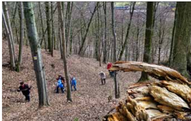
Vycházka okolo Bludova – Bludovská stráž