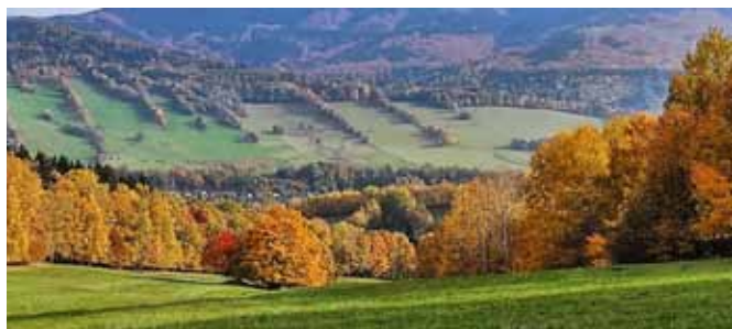
Podzimní vycházka – výhled na Loučnou nad Desnou