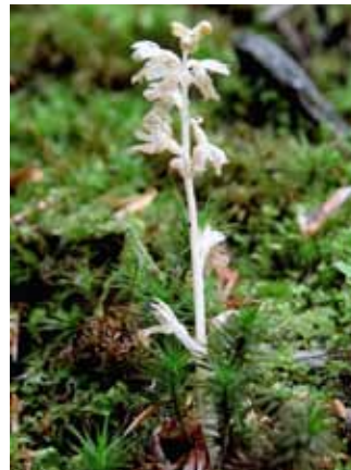
Neottia nidus-avis f. nivea