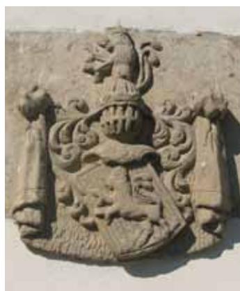
11. září 2011 Bludov – žerotínská hrobka