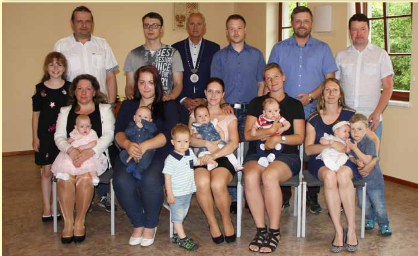
Vítání občánků Bludov 4.6. 2019