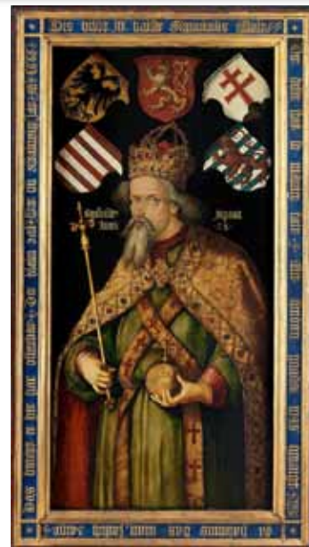
Zikmund (podobizna od Albrechta Dürera)