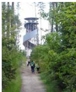
cesta na Velký Kosíř