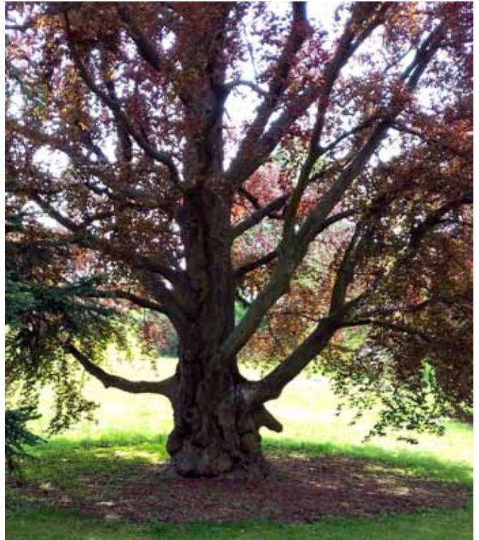
krása starých stromů