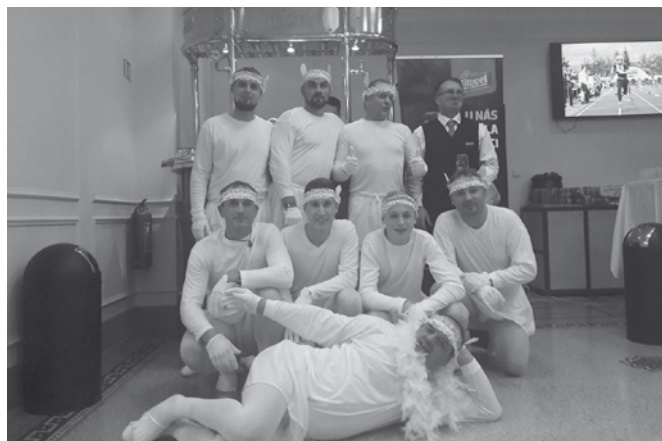
Muži SDH Bludov na Gala odpoledne v divadle pod Palmovkou v Praze.