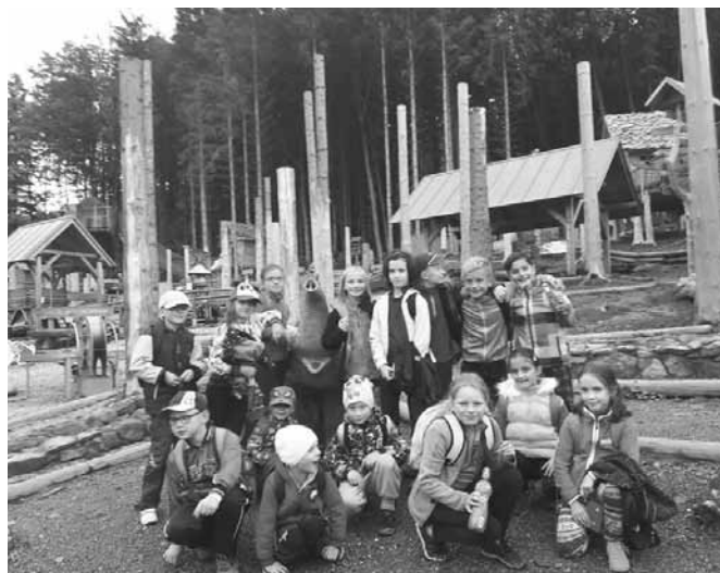
Výlet Mladí hasiči Dolní Morava.

Nejmladší hasičská drobtina vyrazila se svými vedoucími do dětského zábavného parku Dolní Morava. Děti si dosyta užily Lesního zážitkového parku i Mamutíkův vodní park.