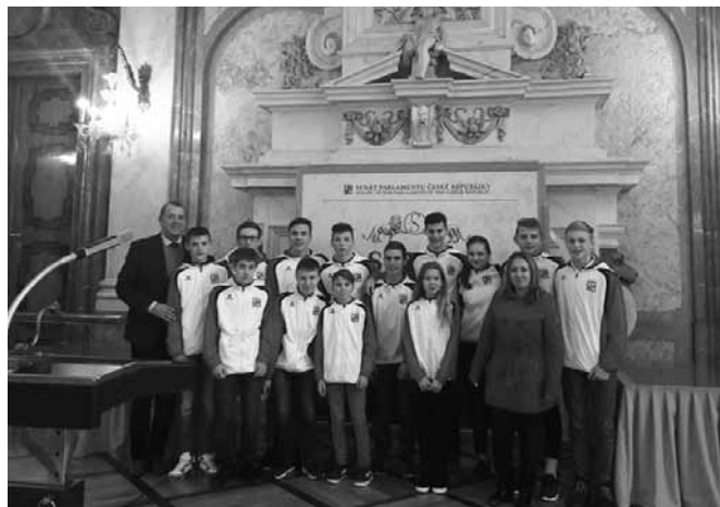
Návštěva Mladých hasičů v Senátu Parlamentu ČR.