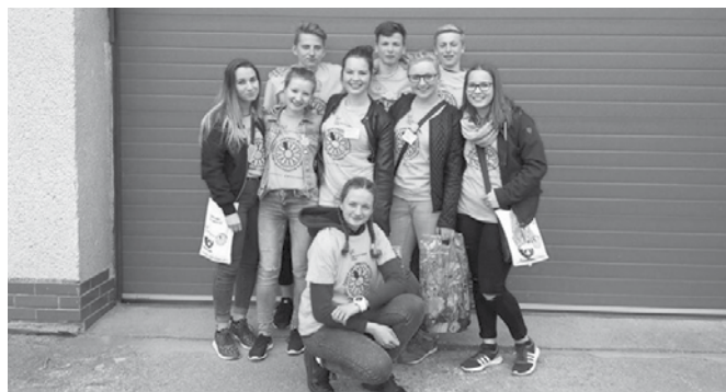
Mladí hasiči prodávali kvítka proti rakovině.