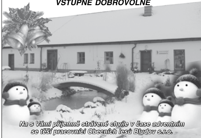
Na s Vámi příjemně strávené chvíle v čase adventním se těší pracovníci Obecních lesů Bludov s.r.o.