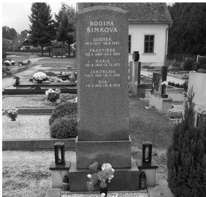
Hrob Františka Šimka na bludovském hřbitově