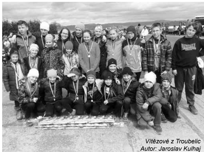
Vítězové z Troubelic

Z celkem 6 absolvovaných soutěží ročníku 2016/2017 obě družstva ve všech zvítězila a kráčí tak zatím za svým cílem, kterým je vítězství v celém ročníku. Velkou pochvalu za statečný výkon si zaslouží bludovské zálohy. Starší družstvo „B“ sice absolvovalo závod mimo hodnocení, protože jsme si i díky