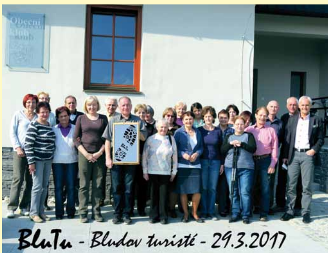
BluTu - Bludov turisté - 29.3.2017