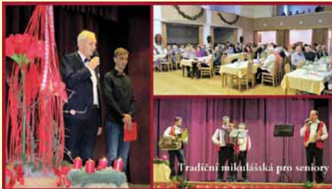
Tradiční mikulášská pro seniory