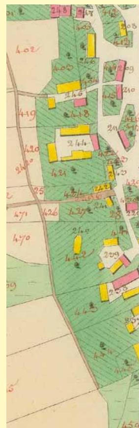
Část Špalkovy ulice