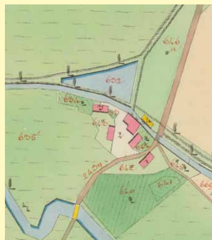
Areál bludovského (Habermannova) mlýna

Na jihovýchodní straně Špalku jsou rozsáhlé pastviny – zřejmě to byly ty, o něž se bludovští poddaní za Marie Terezie soudili s vrchností. Na jižním okraji listu vidíme areál pozdějšího Habermannova mlýna, tehdy snad řečeného Bludovského mlýna. Téměř všechny stavby jsou zděné, zděný je i dům na místě dnešní Habermannovy vily (ta byla ale v dnešní podobě postavena až v roce