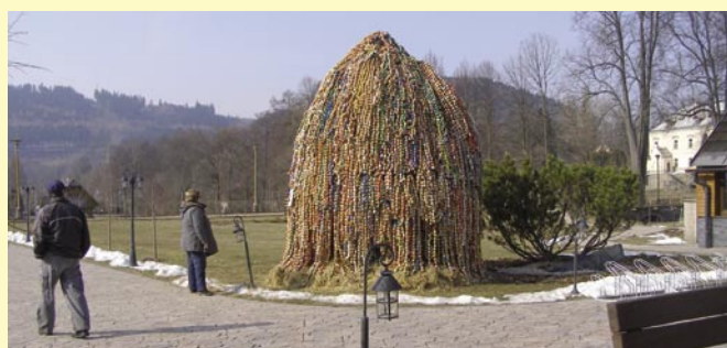
Opět ji obdivovaly davy návštěvníků a byla krásně viditelná z hlavní silnice, letos chvíli i pod sněhem.