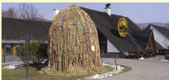
Bludovská obří kraslice ožila po dobu letošních Velikonoc u Koliby Permoník v Sobotině