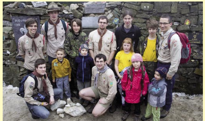
Skautky a skauti z Bludova u mohyly na Ivančenu