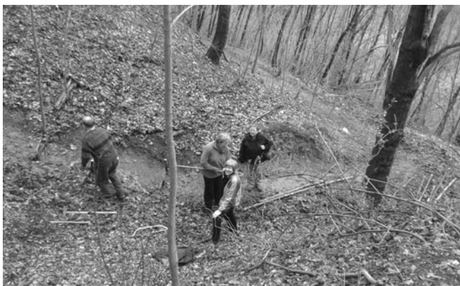
Práce ve svahu nad nádražím