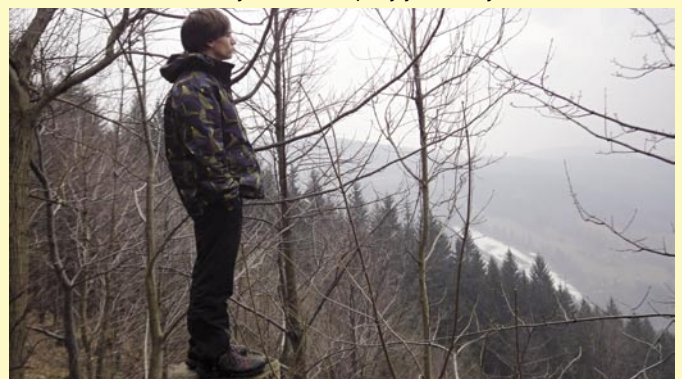
Výhledy do mlhou zahalených beskydských vrchů