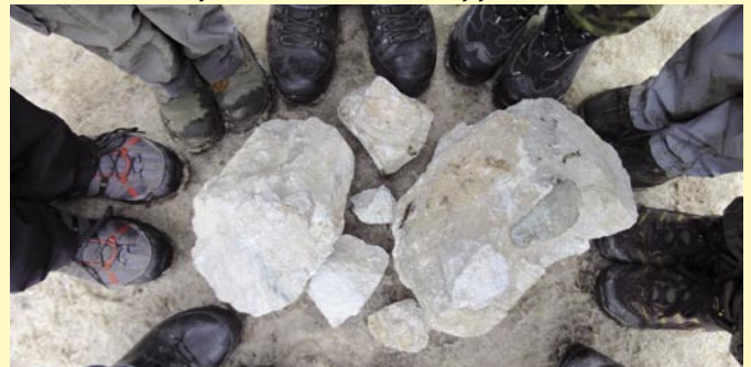
Bludovity, které letos přibyly na mohylu