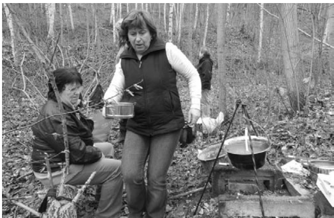
Zasloužená odměna - smčí guláš z myslivecké výstavy