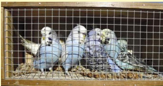
Andulky chovatele Pavla Brulíka z Loštic