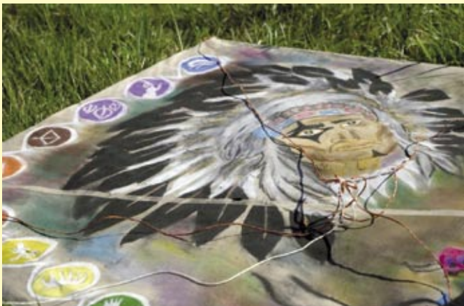
Nejkrásnější letošní drak Indián