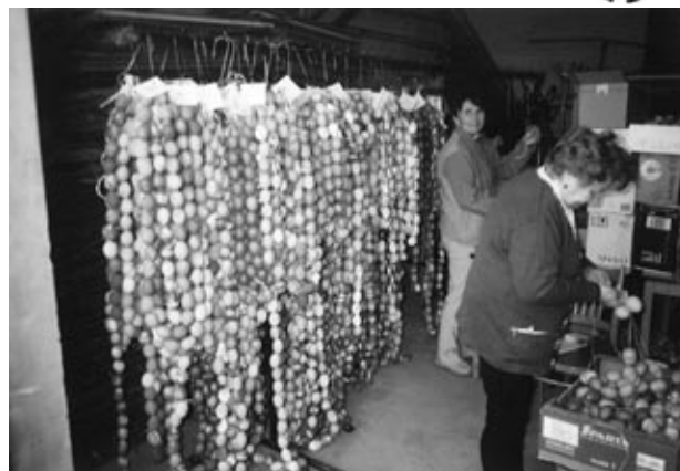
Foto z přípravy rekordu v roce 2007.