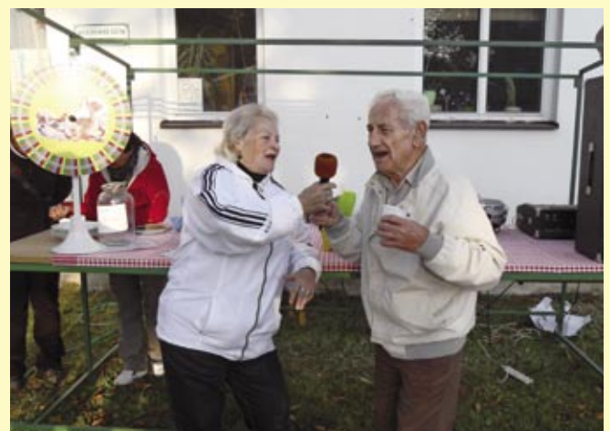
Vítězové soutěže hledáme nové talenty