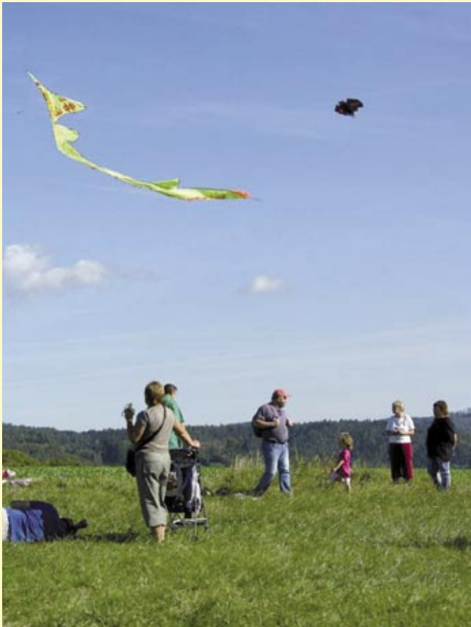
Počasí jako malované

S drakem se nesoutěží jen o nejlepší let, ale také o nejkrásnějšího draka a o nejhorší pád. Letos měla úspěch družina Lišáků se svým drakem Indiánem, která se umístila na 1. místě v kategorii nejhezčí drak. Hned za nimi následovala smečka vlků (vlčata) se svým drakem Šmoulou, který se umístil na místě druhém. Měli jsme ohromnou radost. Dalo nám velkou práci draka vyrobit a namalovat, ale stálo to za to. Drakiáda přilákala mnoho lidí, celá akce se hezky, navíc v pěkném počasí, vydařila.