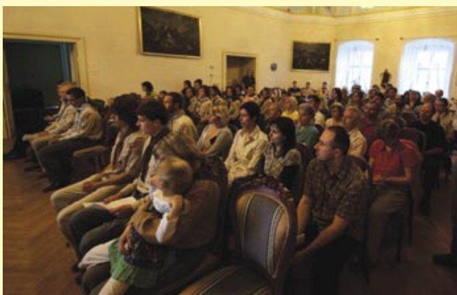
Slavnostní schůze na zámku