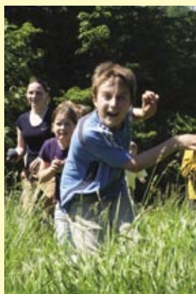
Velká hra vrcholů