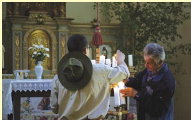
Před bohoslužbou u kostelíčka

Oslavy začaly v pátek 4. června, kdy proběhla slavnostní středisková schůze v koncertním sále bludovského zámku. Schůze se zúčastnilo téměř 100 hostů, rodičů, současných i někdejších členů a dalších příznivců. O proměně vnímání skautingu v Bludově svědčí jedno srovnání – zatímco při posledních velkých oslavách v roce 1998 se obdobné schůze na zámku z pozvaných členů bludovské rady nezúčastnil starosta, ani místostarosta, pouze jeden radní, který byl navíc bývalým členem Junáka. Letos se schůze zúčastnil starosta, místostarosta a jeden radní.