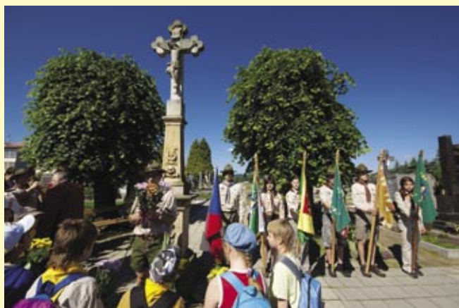
Pietní akt na hřbitově