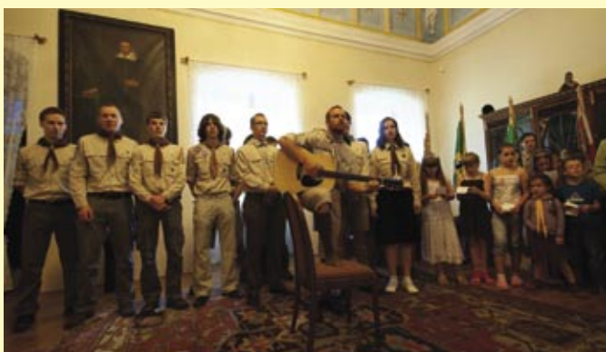
Členové střediska při Lilie skautské