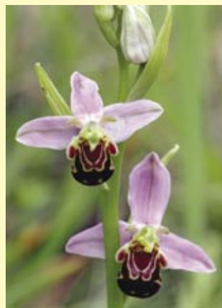
orchideje - klenoty přírody.

života se usadil v Čechách a roku 1884 byl za svůj přínos vědění dekorován řádem sv. Stanislava, které mu udělil ruský car. Zemřel 14. října 1885 a jeho pohřbu se zúčastnil i sám císař. Pochován je na hřbitově v Panském Týnci, v hrobu svého otce, jak si přál.