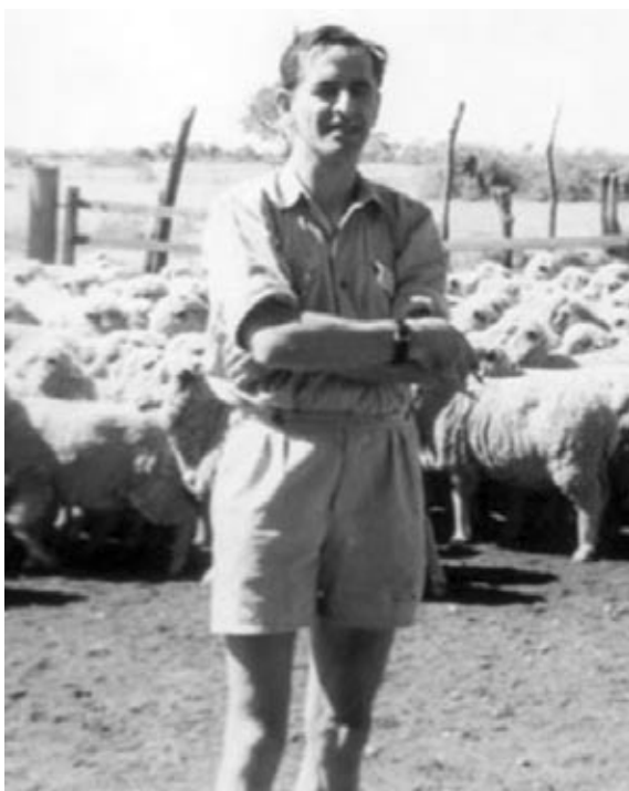
Foto č.7; Austrálie, Queensland (1951- 1952.). Region Cloncurry Council, velkostatek Ardmore v zemědělské osadě Dajarra.,