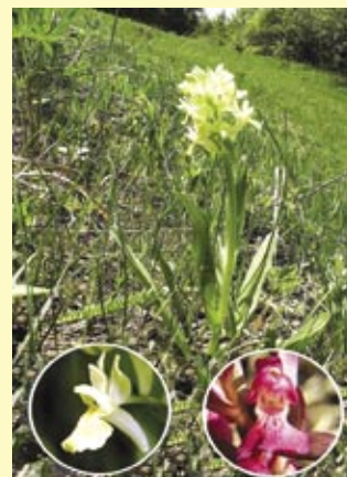
orchideje - klenoty přírody.

prstnatec bezový - Dactylorhiza sambucina (L.) Sod.