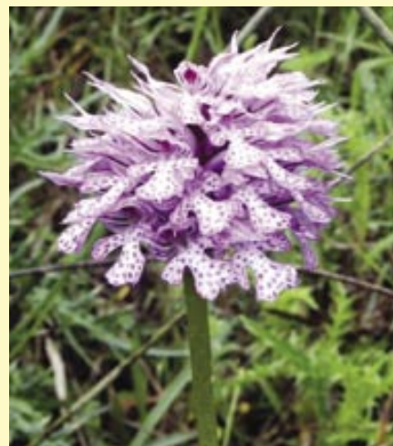
orchideje - klenoty přírody.

Věříme, že naše povídání o orchidejích vás zaujalo a nás bude těšit váš zájem o poznání naší květeny v dalším čísle Bludovanu.