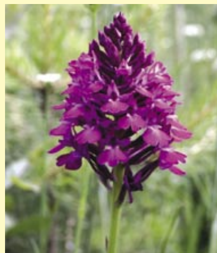
orchideje - klenoty přírody.

nobílkové jehlanovité - Anacamptis pyramidalis (L.) L.C. Richard