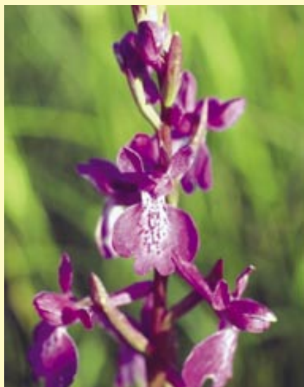
orchideje - klenoty přírody.

Orchideje jsou ve vývoji mladou skupinou, která se nachází stále ve fázi evoluce a jejich odlišnost od ostatních rostlinných druhů zaujala vědce již v dávných dobách. O tom svědčí rytiny ve starých herbářích. Nezajímali se však o krásu, ale o využívání v medicíně. Čím více druhů se nacházelo, dávala se jim jména, tím více se přicházelo na to, že existují různé rostliny stejného jména