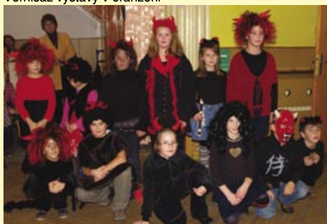
Mikulášská pro důchodce