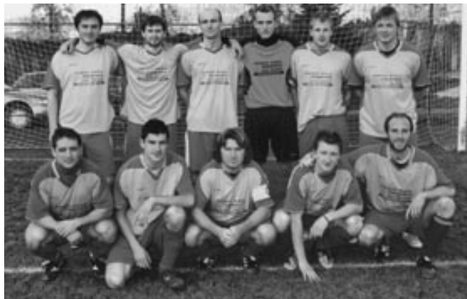
Sokol Bludov A vítěz podzimu 2009 - 10 krajská soutěž 1. B tř. sk. C

Zcela bezpochyby zklamalo mužstvo mužů „B“, v kterém skončilo několik zkušených hráčů s vyšším věkem. Dalším důvodem jejich nelichotivého postavení v tabulce je tréninková absence a morální nedisciplinovanost několika hráčů, kteří takto srážejí celý tým. Neustále se měnící sestava, přestárlost mužstva, doplňování mužstva „A“, četné omluvenky na zápasy nás nutí k zamyšlení nad perspektivou a dalším vývoje tohoto mužstva.