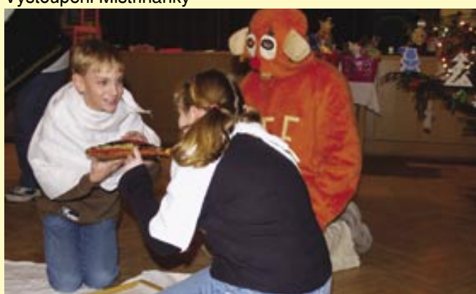
Mikulášská pro děti