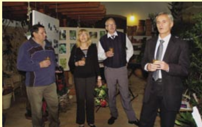
Vernisáž výstavy v oranžérii