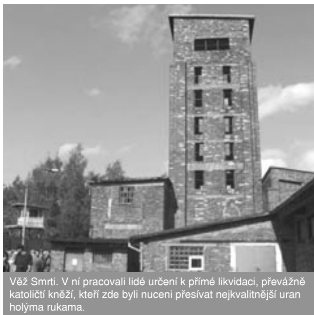
Věž Smrti. V ní pracovali lidé určení k přímé likvidaci, převážně katolickí kněží, kteří zde byli nuceni přesívat nejvyšší kvalitu uranu holýma rukama.