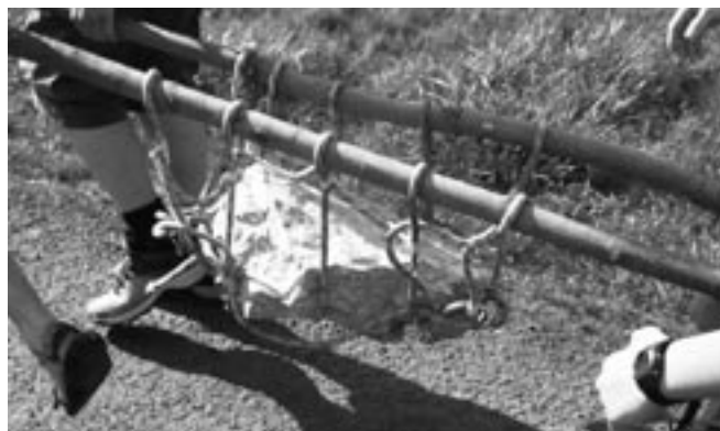
Už se nese...