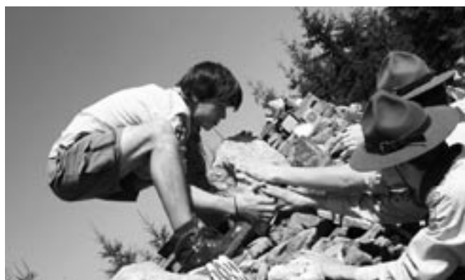
Bludovít získává své místo v mohyle