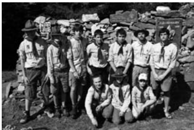
Bludovští skauti u mohyly

Pro nás byl však letošní výstup, uskutečněný po několikaleté mezeře ze všelijakých důvodů, v mnohém netradiční. Za prvé, vlak EC, kterým jsme plánovali jet, měl poruchu lokomotivy, a když už měl být v Zábřeze, tak stál kdesi v polích za Prahou.