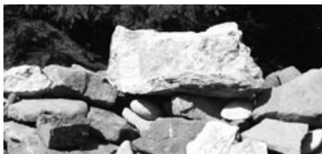
A už je tam. Napořád.