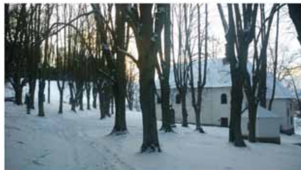
Požehnané svátky vánoční vám přeje Spolek pro Kostelíček Božho Těla.