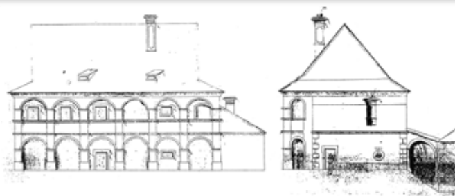
Budova letohrádku na Bludovečku před rokem 1741

Zierotin ( http://genealogy.euweb.cz/bohemia/zierotin1.html#P3 ).