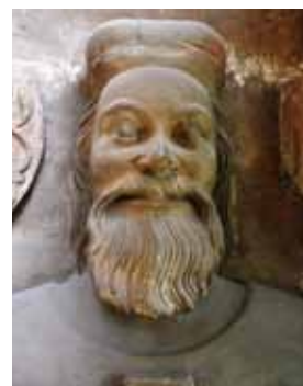
Busta Jana Jindřicha Lucemburského ve Svatovítské katedrále

V držení bludovského panství ho vystřídal nejprve Prokop (narozen v roce 1358 v Brně). Ten vládl Moravě spolu s Joštem jako jediný spoluvládce, poté co zemřel v roce 1380 Jan Soběslav. Po jeho úmrtí se starší markrabě Jošt s Prokopem majetkově vyrovnali. Když byli zataženi do sporů mezi svými bratrance Václavem IV. a Zikmundem, skončila jejich spolupráce